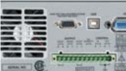
Задняя панель прибора серии 2200.